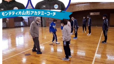
モンテディオ山形アカデミーコーチ

参加をご希望の方は、11月15日(火)までに、下記連絡先にお名前をお知らせください。